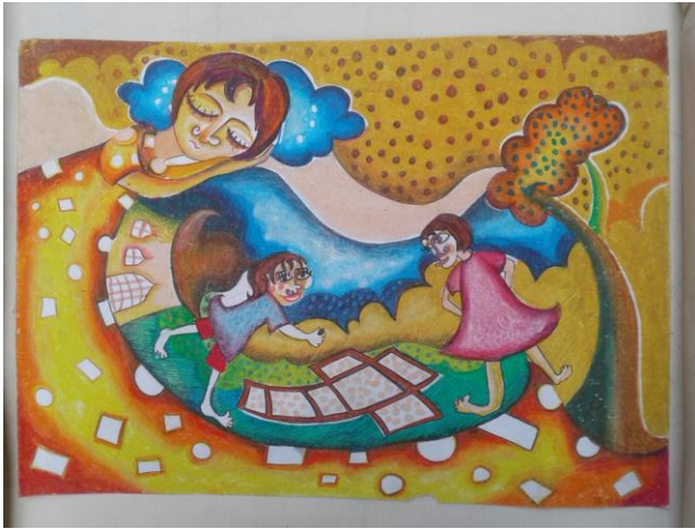
Judul karya: Ingking, Ukuran: A3 , Media: Crayon di atas kertas