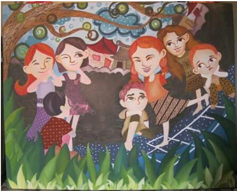
Judul karya: Ingking, Ukuran: 120 x 160 cm, Media: Akrilik di atas kanvas