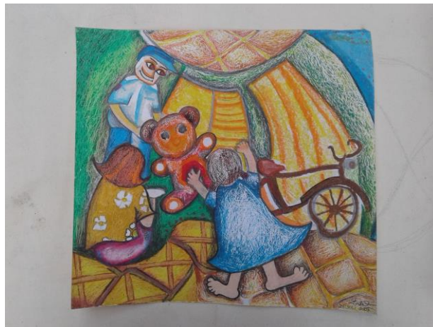
Judul karya: Hadiah dari bapak