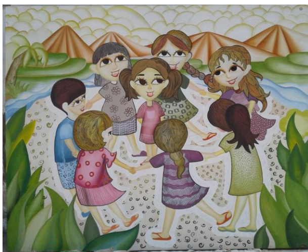
Judul karya: Jamuran, Ukuran: 120 x 160 cm, Media: Akrilik di atas kanvas