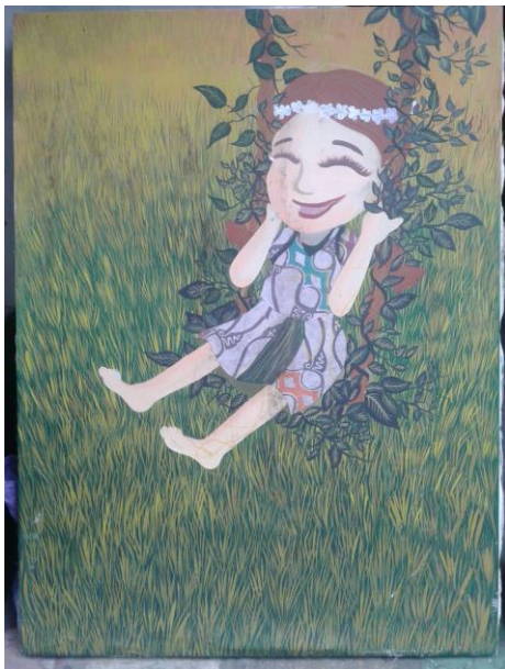
Judul karya: Ayunan,