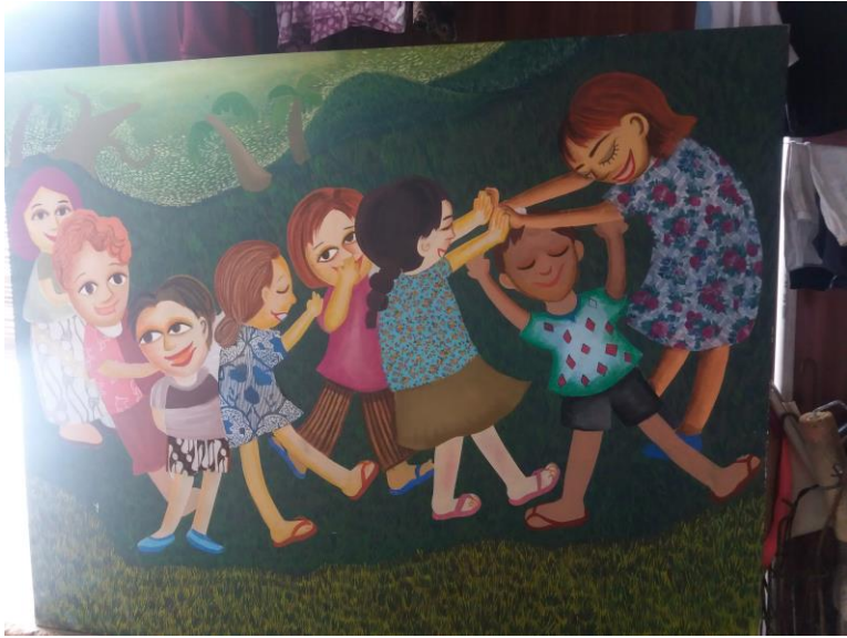
Judul karya: Jamuran, Ukuran: 120 x 160 cm, Media: Akrilik di atas kanvas