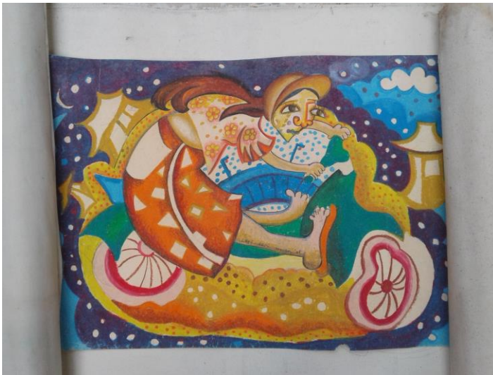
Judul karya: Berlari, Ukuran : A3, Media: Crayon di atas kertas