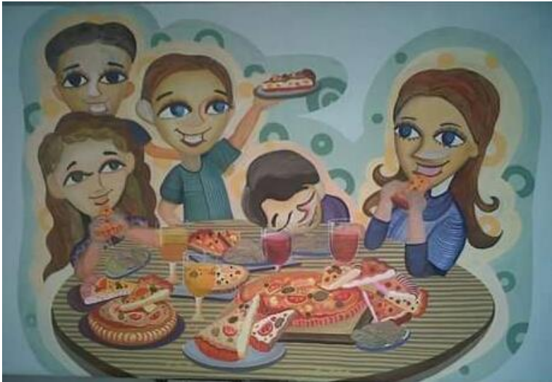
Judul karya: Makan Pizza, Ukuran: 120 x 140 cm, Media: Akrilik di atas kanvas