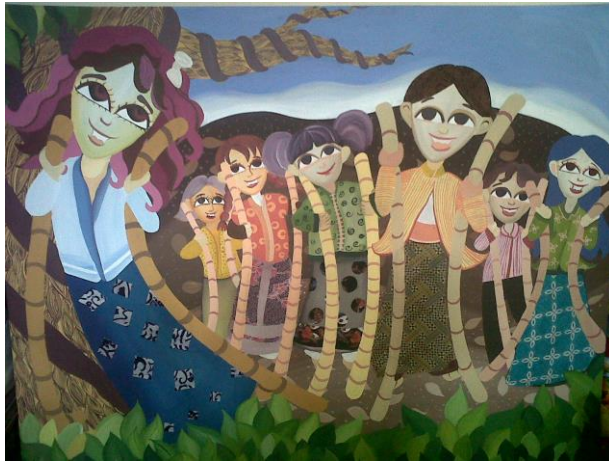
Judul karya: Englek, Ukuran: 120 x 160 cm, Media: Akrilik di atas kanvas

10 Karya dekoratif dengan tema 'Dolanan bocah'.